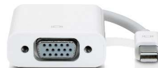
図-2 プロジェクター接続用 ケーブル端子 (Mac 用)